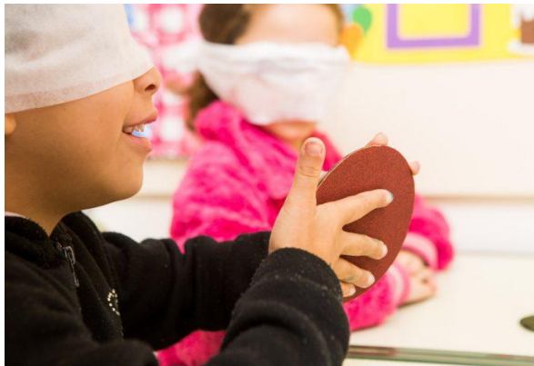
Imagem da atividade.